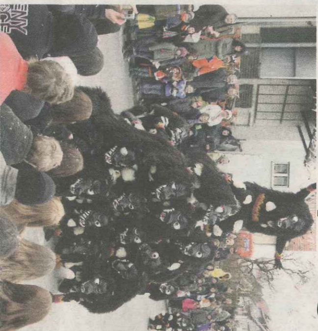
66 Gruppen haben sich zum Narrensprung am Sonntag angemeldet

Der 48. Narrensprung beginnt am 19.2. um 14 Uhr. Danach wartet die Party in der Mehrzweckhalle, im Zelt und auf dem Dorfplatz. Zur Verflechtung gibt es Kaffee und Kuchen in der Zunftstube. Ebenfalls im Jugendheim bei der Kirche durch den Frauenbund und durch Stände anderer Vereine wie z.B. der Kriegerverein und