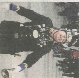
Höhepunkt 2: Der fröhliche Umzug